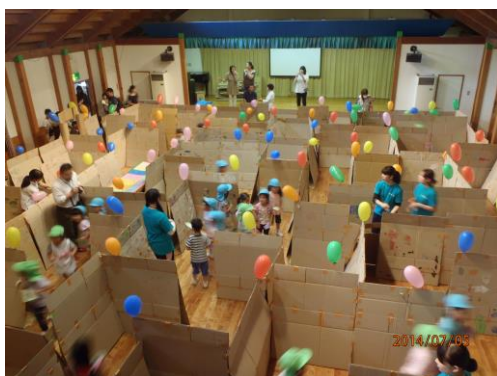
段ボール迷路遊び