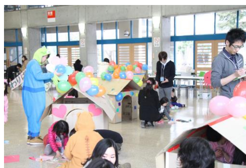
段ボールハウス作り