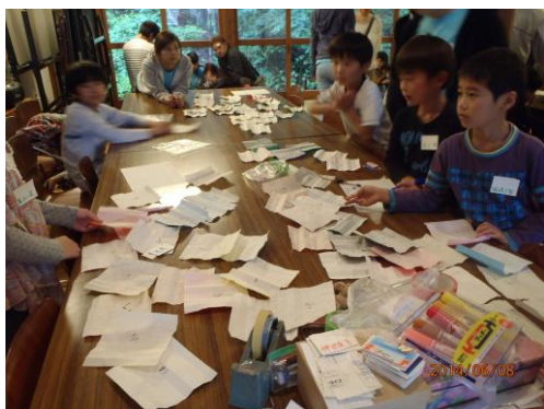
宝探し・言葉合わせ遊び